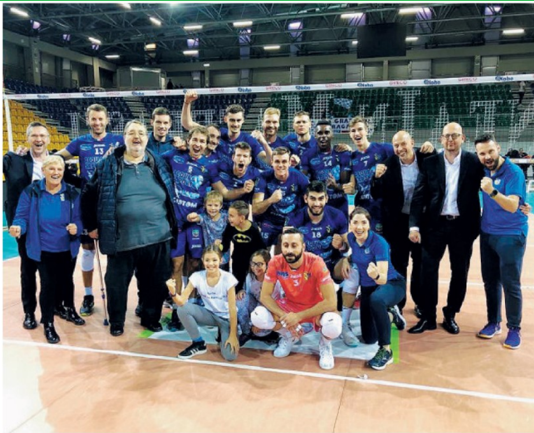
Il gruppo della Top Volley posa insieme al sindaco di Cisterna, Mauro Carturan